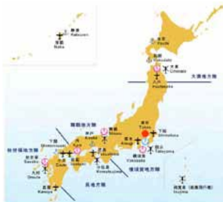
全国に配置された海上自衛隊の基地

また最近では、ソマリア沖・アデン湾における海賊船対処のために、艦艇や航空機が派遣され、民間船舶の護衛や海域の監視警戒を行っている。国防に限らず、こうした国際貢献活動も積極的に行っている。