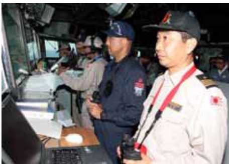
海賊船対処活動の水上部隊

インストールの際には、米海軍やNATO軍と同様に、メールクライアントとも自動的に連携させている。これにより、隊員が特別な操作をしなくても、自動的に送信メールの添付ファイルが圧縮されるという運用を実現している。