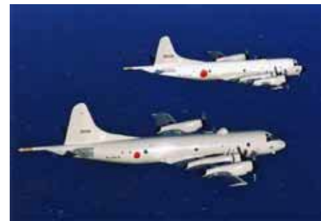
海上自衛隊の哨戒機 P-3C

こうした導入効果を受け、現在購入済みの5,000ライセンスから、将来的には2万～2万5,000ライセンスへと導入範囲が広がる可能性もあるようだ。