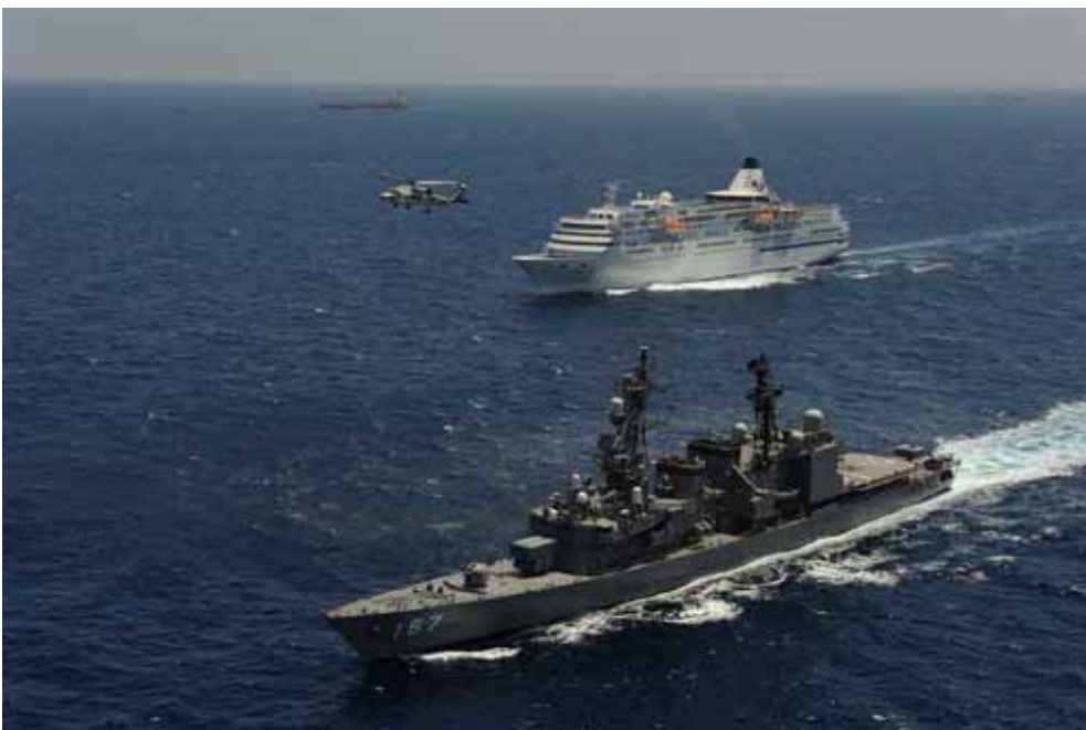
ソマリア沖で民間の船舶を護衛する海上自衛隊の護衛艦と哨戒ヘリコプター

NXPowerLiteの導入により、陸上の基地はもちろん、艦艇の上でも、写真を貼り付けた重い文書ファイルをサクサク送受信できるようになった。艦艇へもより迅速かつ確実に重要な報告事項を伝達することができるようになった