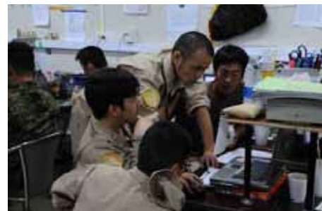
艦艇ではファイルの受信に時間がかかっていた

海上自衛隊の海外派遣活動においては、艦艇がまさに任務の最前線である。最前線にいる艦艇の搭乗員が、必要な情報を迅速にやり取りできず、「情報弱者」になってしまっていたのだ。