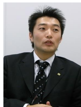
地道な「お客様目線での行動」の積み重ねが、信頼関係の基盤となります

PowerPointファイルの圧縮も、このような行動と同じです。お客様の立場で、重いファイルを受け取ったらどう感じるかを考えます。…決していい気分にはなりませんよね。