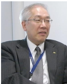
「こんなに軽くなるんだね」と、お客様に喜ばれた営業担当者は大勢います

まず、NXPowerLiteの圧縮比率の高さに感心しています。初めて体験版を使ったとき、3MBのPowerPointファイルが数百KBまで圧縮されたのには驚きました。