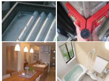
資料に盛り込まれる写真の例

作成される資料には、とても多くの写真が使われます。たとえば定期診断では、部品や設備の老朽化をチェックするために住居のさまざまな場所を、さまざまな角度から撮影します。そしてリフォームやメンテナンスをご提案する際には、完成イメージや他のお客様の事例など、多くの写真が盛り込まれた資料を作成します。そしてリフォームを実施させていただく時にも、「ビフォー／アフター」の状態をきちんと記録